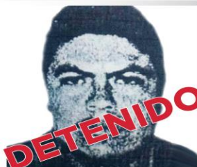
Oswaldo Torres Macedo Causa Penal: 103/2011